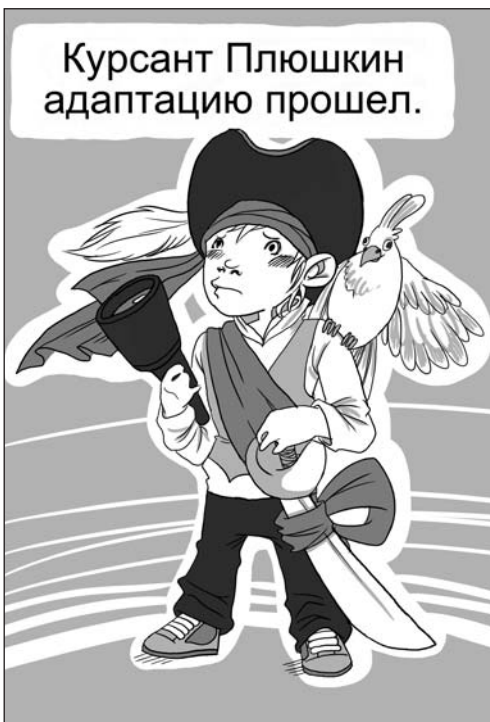
Рисунки в номер выполнила Кристина Звезжинская

Следовательно, методы и приемы обучения, используемые на курсах в гимназии, – развитие индивидуаль-