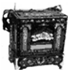
Шарманка (портативный орган)

А вот механические музыкальные инструменты.