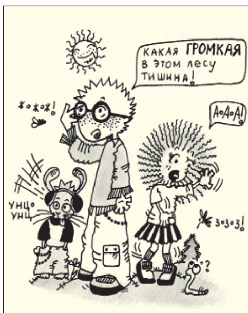
Рисунок Кристины Звездинской

– Молодцы, какие вы все внимательные! А теперь скажите, вы любите в прятки играть?.. Я тоже, давайте поиграем.